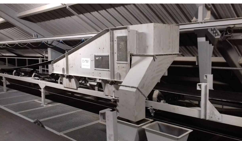
Transporteur à bande ensilage Chariot verseur : un ou deux côtés