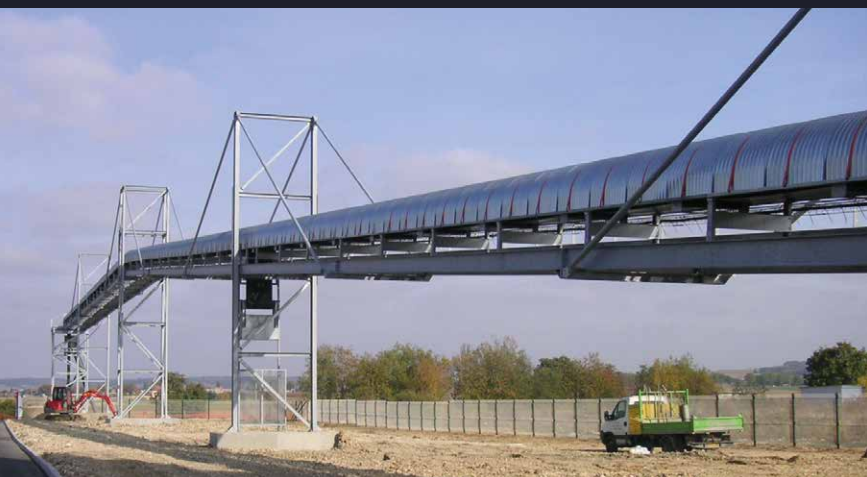
Transporteur à bande de liaison Protection de la bande des intempéries

Ceres Agro-industrie dispose des solutions adaptées, en fonction de votre secteur d'activité.